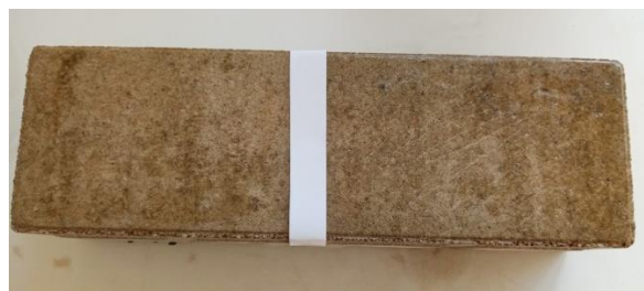
2 vrstvy politury