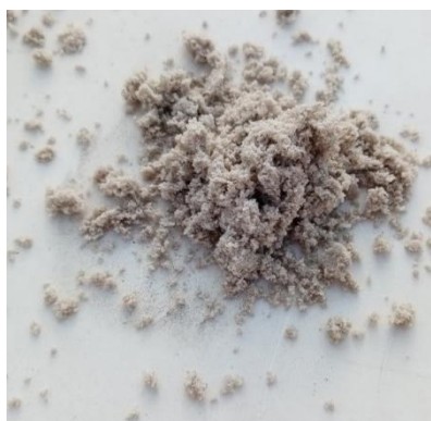
Příklad nevhodné frakce