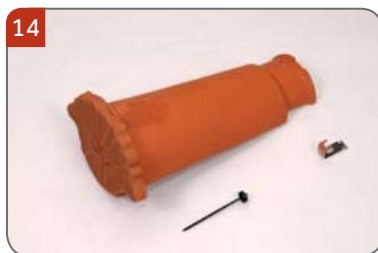
Hřebenáč začáteční malý kónický ozdobný HO s jednou příchytkou hřebenáče HO + N a s jedním vrutem Pro začátek hřebene, nároží a konec hřebene do malty.