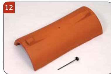
Hřebenáč vyrovnávací dvouhrdlý kónický HO s jedním vrutem K vyrovnání délky hřebene.