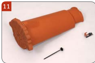
Hřebenáč začáteční ozdobný kónický HO s jednou příchytkou hřebenáče HO + N a s jedním vrutem Pro začátek hřebene, začátek nároží a konec hřebene.