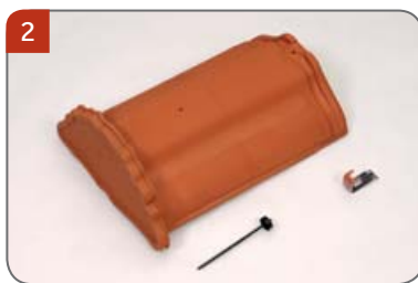
2 Hřebenáč začáteční drážkový HO s jednou příchytkou hřebenáče HO + N a s jedním vrutem Pro začátek hřebene, nároží a konec hřebene.