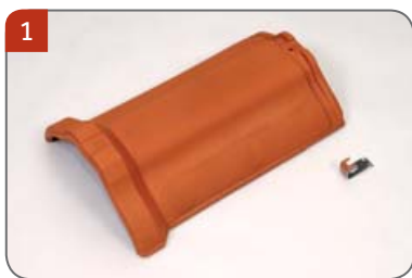
1 Hřebenáč drážkový HO s jednou příchytkou hřebenáče HO + N Pro pokrývání hřebene a nároží.