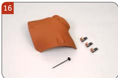
Rozdělovací hřebenáč malý kónický HO s třemi příchytkami hřebenáče HO + N a s jedním vrutem Pro spojení hřebene a dvou nároží do malty.