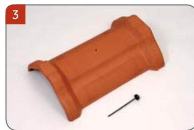
3 Hřebenáč vyrovnávací dvouhrdlý drážkový HO s jedním vrutem K vyrovnání délky hřebene.