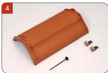
4 Hřebenáč vyrovnávací bez hrdla drážkový HO s dvěma příchytkami hřebenáče HO + N a s jedním vrutem Pro napojení na rozdělovací hřebenáč a k vyrovnání délky hřebene.