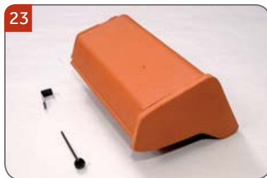
Univerzální pultový hřebenáč začáteční, pravý s jednou příchýtkou hřebenáče HO + N a s jedním vrutem Pro napojení pultové hrany na štítovou.