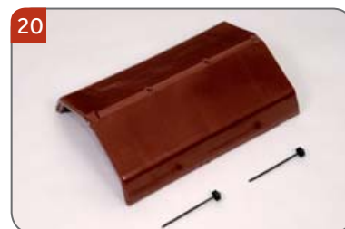
Hřebenáč vyrovnávací dvouhrdlý líniový N s dvěma vruty K vyrovnání délky hřebene.