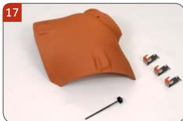
Rozdělovací hřebenáč kónický HO s třemi příchytkami hřebenáče HO + N a s jedním vrutem Pro spojení hřebene a dvou nároží.