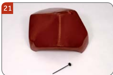
Rozdělovací hřebenáč líniový N s jedním vrutem Pro napojení hřebene a dvou nároží. Pro sklony střech 20°- 60°.