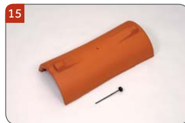
Hřebenáč vyrovnávací dvouhrdlý malý kónický HO s jedním vrutem K vyrovnání délky hřebene do malty.