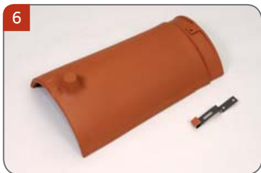
6 Hřebenáč kónický K s jednou příchytkou hřebenáče K Pro pokrývání hřebene a nároží.