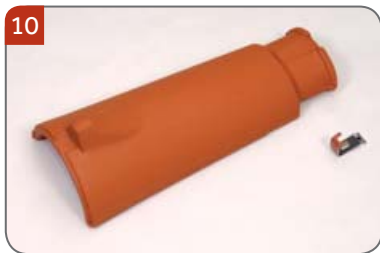
Hřebenáč kónický HO s jednou příchytkou hřebenáče HO + N Pro pokrývání hřebene a nároží.