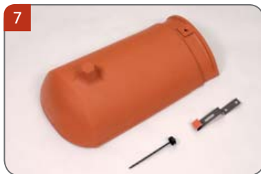
7 Hřebenáč začáteční kónický K s jednou příchytkou hřebenáče K a s jedním vrutem Pro začátek hřebene a nároží.