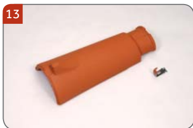
Hřebenáč malý kónický HO s jednou příchytkou hřebenáče HO + N Pro pokrývání hřebene a nároží do malty.