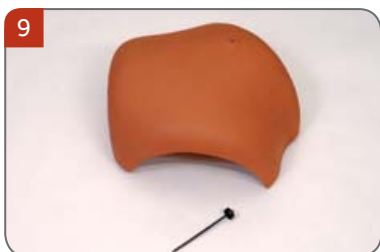
9 Rozdělovací hřebenáč kónický K s jedním vrutem Pro napojení hřebene a 2 nároží. Pro sklony střech 20° až 60°.