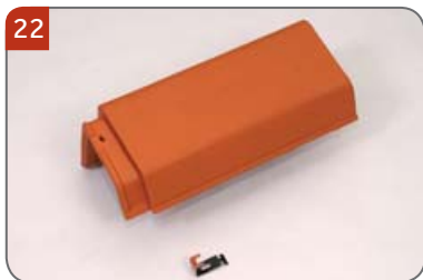
Univerzální pultový hřebenáč s jednou příchýtkou hřebenáče HO + N Pro zakončení pultové hrany.