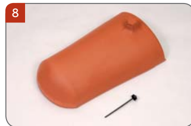
8 Hřebenáč zakončovací kónický K s jedním vrutem Pro zakončení hřebene.