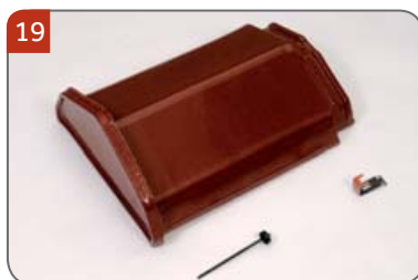
Hřebenáč začáteční líniový N s jednou příchýtkou hřebenáče HO + N a s jedním vrutem Pro začátek hřebene, nároží a konec hřebene.