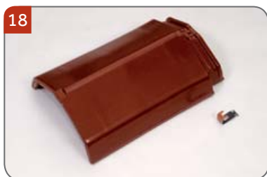
Hřebenáč líniový N s jednou příchýtkou hřebenáče HO + N Pro pokrývání hřebene a nároží.