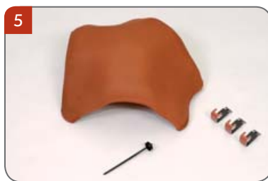
5 Rozdělovací hřebenáč drážkový HO s třemi příchytkami hřebenáče HO+N a s jedním vrutem Pro napojení hřebene a dvou nároží. Pro sklony střech 15° až 55°. Přípevnění: 3 příchytky HO+N se 3 vruty 4x66 mm nebo jeden utěšňovací vrut.